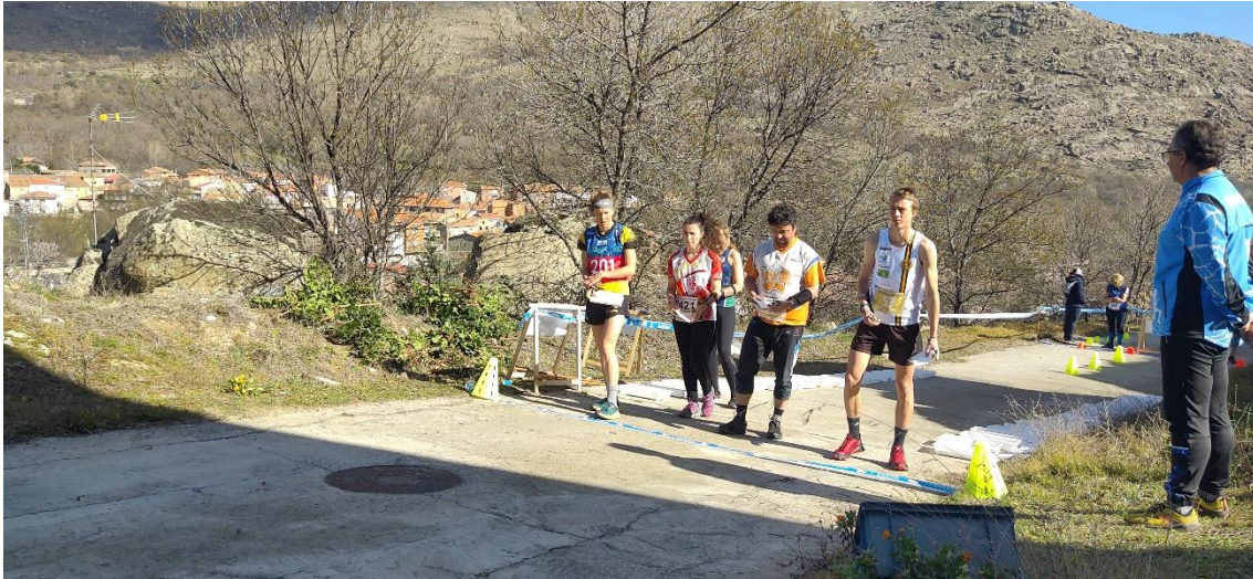
En la imagen Tove Alexandersson (dorsal 201) en la salida del sprint de Navarredondilla del MOM de 2024.

Por motivos excepcionales hemos tenido que cambiar la ubicación y mapa de la prueba de liga de FOCYL y liga norte . La prueba se realizará en el mapa usado en la distancia larga del MOM de 2022, en el monte el Encinar , en El Barraco . Dehesa con zonas abiertas, buen suelo y desnivel moderado, que permite una velocidad de carrera muy elevada. En toda la dehesa se existen numerosos grupos de piedras, pequeñas vaguadas y surcos.